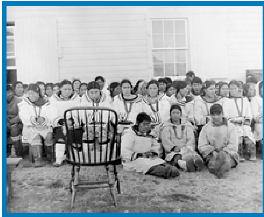
Library and Archives Canada, PA-181324