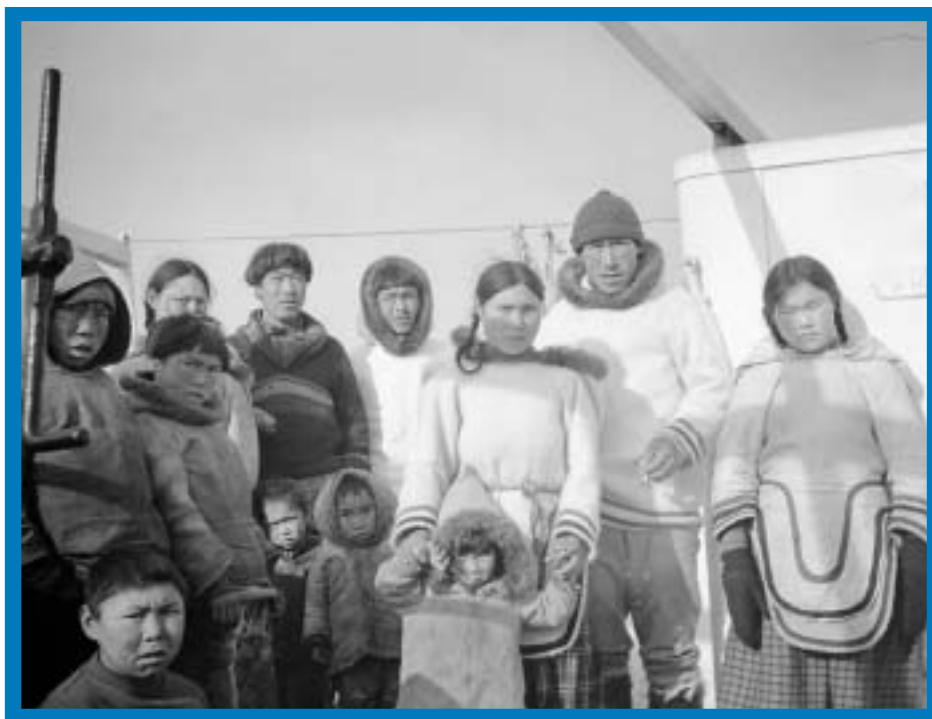
Library and Archives Canada, PA-170054

Entre 1956 et 1963, le nombre de jeunes Inuits fréquentant des externats ou des pensionnats a augmenté considérablement. Ce nombre a cru de 1755 à 3341 dans l'Arctique de l'Ouest, de 201 à 1173 dans l'Arctique de l'Est, et de 39 à 656 dans le district de l'Ungava du Nord du Québec. Le tableau 3 est une liste des pensionnats des Territoires du Nord-Ouest, du Québec, de l'Ontario, du Manitoba et de l'Alberta qu'ont fréquenté des Inuits entre 1949 et 1957.